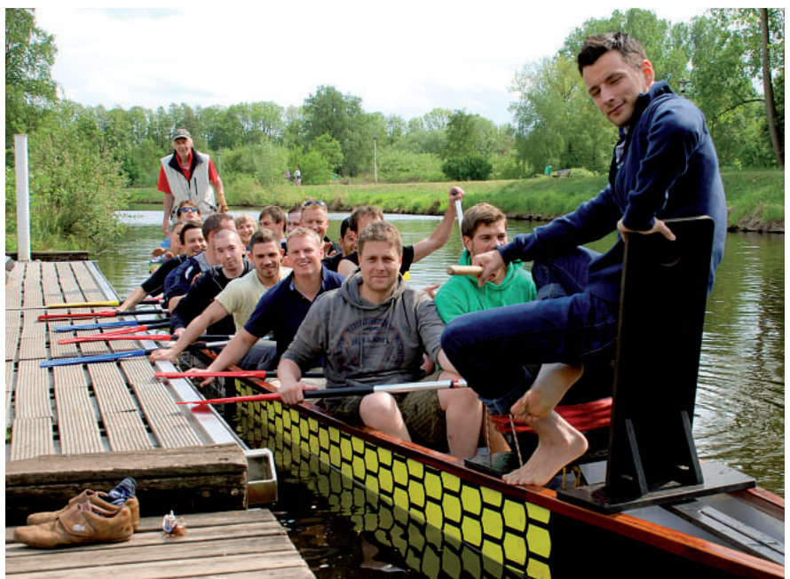
... und Drachenbootrennen.