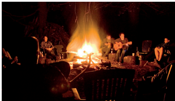
... Lagerfeuerromantik ...

Ich freue mich über die zahlreichen positiven Rückmeldungen zu dem Seminar und möchte alle jungen Kolleginnen und Kollegen dazu ermuntern, ebenfalls einmal an einem Seminar der JUNGEN GRUPPE teilzunehmen!