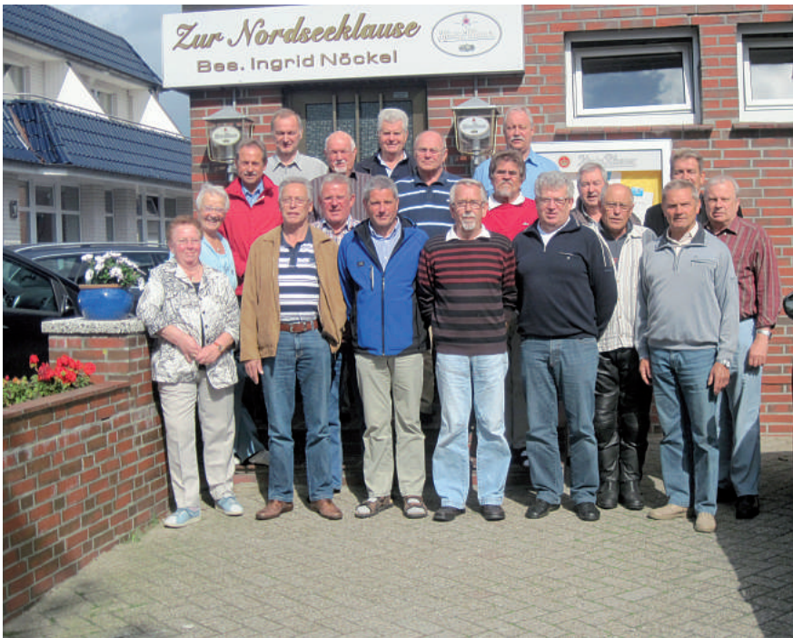
Unsere Pensionäre sind immer noch mit Leib und Seele dabei. Ihre Seminare sind stets ausgebucht.

schaft in der GdP als Pensionär wichtiger ist denn je, denn nur gemeinsam sind wir stark und können auch was erreichen. Das beste Beispiel dafür ist die Versorgungserhöhung zum 1. 4. 2011, natürlich leider wieder mit dem 8. Absenkungsfaktor.