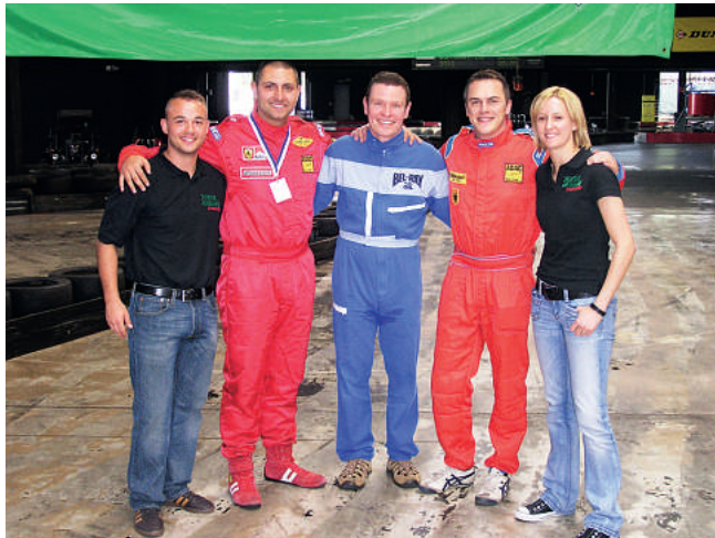
Karcher Racing Team