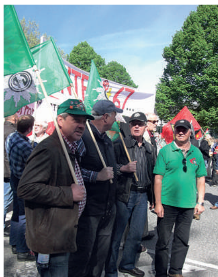
Unsere Fahnenträger auf der Demo!