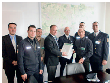
Mit wichtigen Forderungen bei Innensenator Neumann

führung. Ein weiterer wichtiger Punkt war die Alimentierung der Studenten auch während der ersten acht Monate des Studiums. Hier wird der Senator gemein-