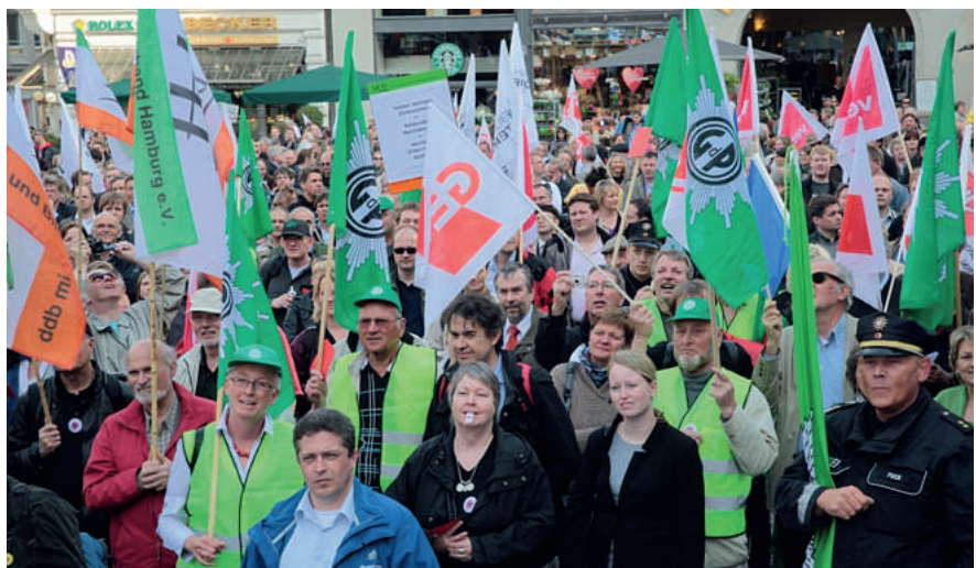
Zur Abschlusskundgebung auf dem Gänsemarkt!

Bereits kurz nach Redaktionsschluss fanden weitere Gespräche mit dem Bürgermeister und anderen politischen Verantwortlichen statt, um nicht locker zu lassen und die schwerwiegenden Einschnitte zu vermeiden. „Die in ersten Gesprächen dargestellten Lösungen sind aus Sicht der Gewerkschaften nicht akzeptabel“, stell-