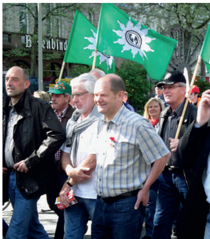
Mit Bürgermeister Olaf Scholz auf der Straße

An der Hauptdemonstration nahmen auch Hamburgs Erster Bürgermeister Olaf Scholz sowie Wissenschaftssenatorin Dorothee Stapelfeldt und Stadtentwicklungssenatorin Jutta Blankau teil.