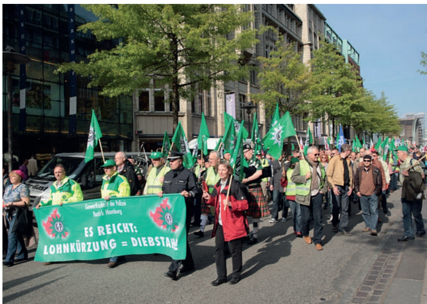
Durch die Mönckebergstraße

„Ein unfassbarer Vorschlag, den der ehemalige Bürgermeister Ahlhaus in die Diskussion gebracht hatte“, stellt der