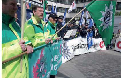
Die GdP, nicht eingeladen und dennoch vor Ort!

So nicht! Uns reicht es! Lohnkürzungen sind Diebstahl!