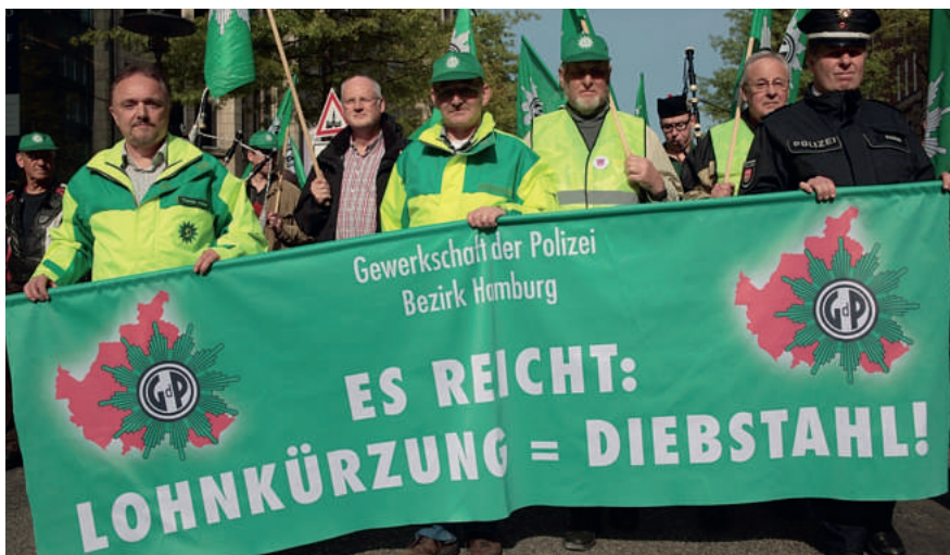
Eine eindeutige Botschaft!

und wesentlicher Gehaltsbestandteil. Sie ist eine Sonderzahlung, die ihren Ursprung in vielen bereits geleisteten Verzicht und Kürzungen hat. Und für eine solche Gehaltskürzung hat der Hamburger Senat die Rote Karte verdient.