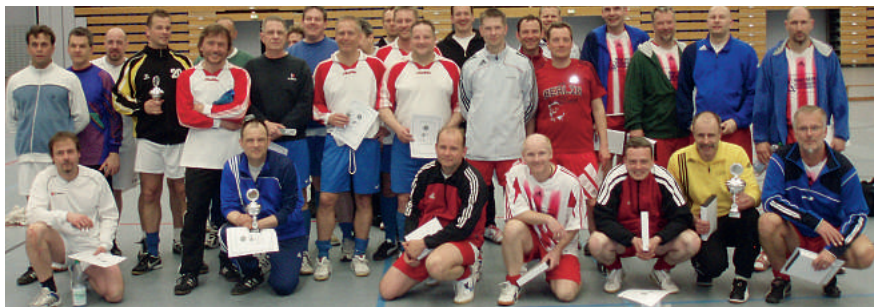
Die erfolgreichen Teams des Ü-35-Cups.