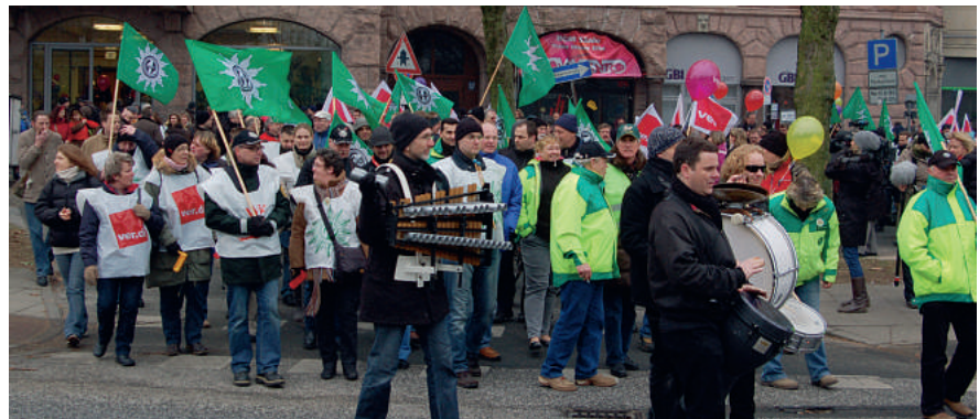
Mit Musik zum Gänsemarkt!