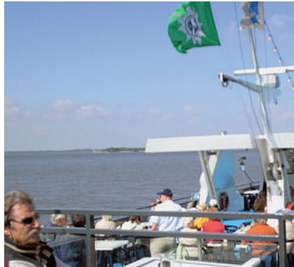
Die GdP-Flagge wird auf der Hammonia wehen