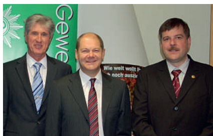
Uwe Koßel, Landesvorsitzender, und O. Scholz, Erster Bürgermeister, mit Gerhard Kirsch, stellv. Landesvorsitzender

Wir werden uns weiter auf allen Ebenen gegen eine massive Gehaltskürzung in der Beamtenbesoldung zur Wehr setzen. Die Beamten Hamburgs sind nicht verantwortlich für eine verfehlte Haushaltspolitik des ehemaligen schwarz-grü-