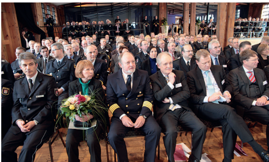
Ein angemessener Ort: das „Internationale Maritime Museum“