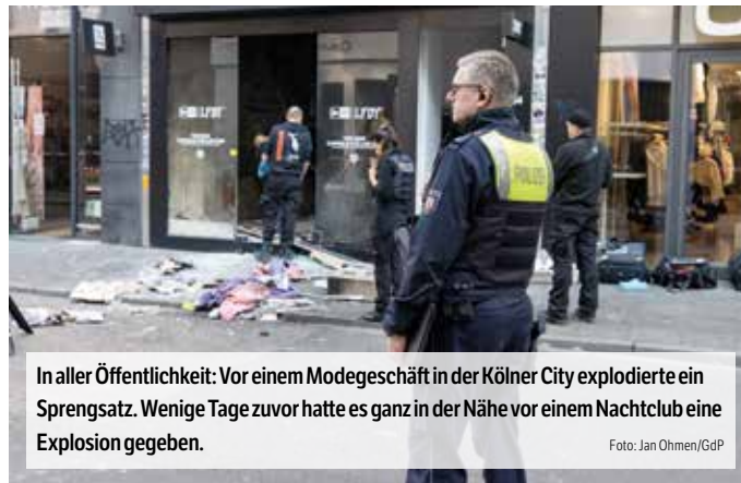
In aller Öffentlichkeit: Vor einem Modegeschäft in der Kölner City explodierte ein Sprengsatz. Wenige Tage zuvor hatte es ganz in der Nähe vor einem Nachtclub eine Explosion gegeben.

Innenminister Herbert Reul (CDU) berichtete Ende September im Innenausschuss des