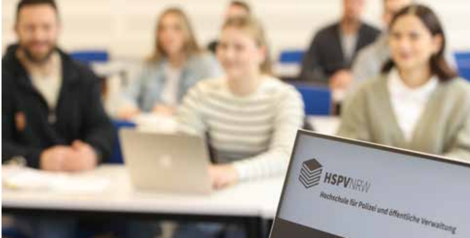
Alle drei Ausbildungsträger machen einen guten Job, können aber nicht zaubern.

QR-Code scannen, anmelden und bei ausgewählten Marken sparen.