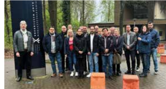
Tief bewegt: die Teilnehmerinnen und Teilnehmer der GdP-Gedenkstättenfahrt in Westerbork

Rassismus und Antisemitismus sind leider keine Phänomene nur in der Vergangenheit. Deshalb bietet die GdP bereits seit Jahren Bildungsseminare zum Thema „Polizeigeschichte und Nationalsozialismus“ am Geschichtsort der Villa ten Hompel in Münster an. Im April wurde das Seminar nun das erste Mal mit dem Besuch einer Gedenkstätte in Westerbork verbunden.