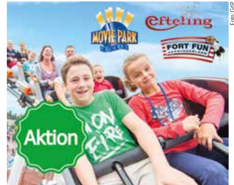
Eine gute Zeit mit der Familie erleben: GdP-Mitglieder können vergünstigt ausgewählte Freizeitparks besuchen.