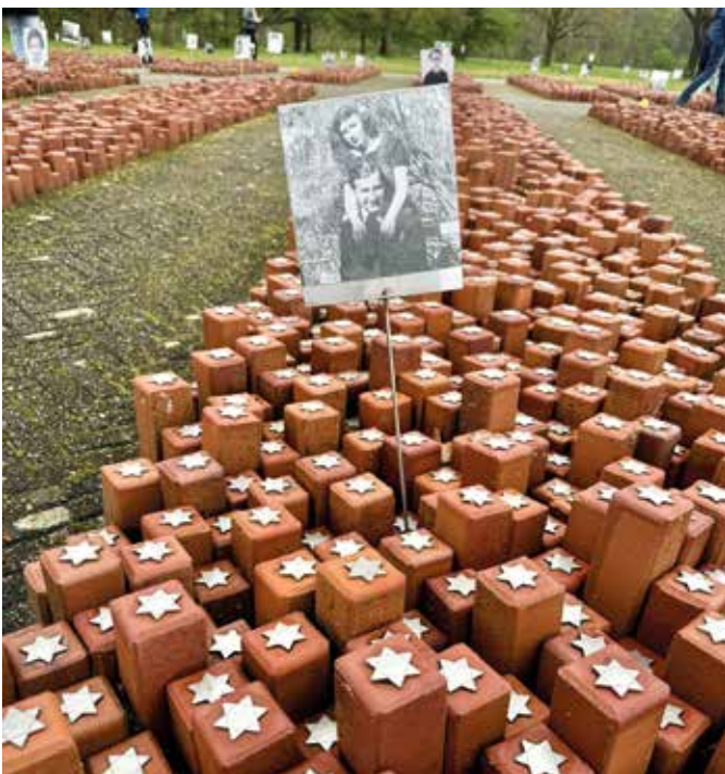
Das Monument „De 102.000 Steinen“: Jeder Stein steht für einen ermordeten Deportierten.

Der letzte Tag des Seminars fand wieder am Ausgangspunkt in der Villa ten Hompel statt und galt der Reflexion. Aber wie fasst man ein derart intensives Seminar zusammen? In diesem Zusammenhang wurden „Werte“ diskutiert, die es damals und heute gab und gibt und an denen sich Polizeibeschäftigte orientieren: „Ehrlichkeit, Rechtschaffenheit, Loyalität, Vertrauen“ wurden vielseitig genannt. Dabei wurde klar, dass diese Begriffe dehnbar sind und nicht für jeden zu jeder Zeit das Gleiche bedeuten. Und damit war die abschließende Frage nach dem „Kann so etwas nochmal geschehen?“ am Ende nicht eindeutig zu beantworten. ■