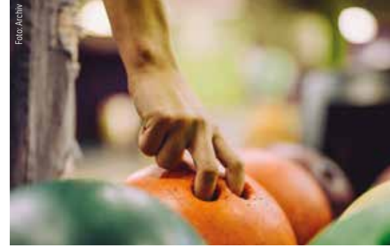
Hier wird keine ruhige Kugel geschoben: Das GdP-Bowlingturnier ist ein Highlight im Eventkalender.