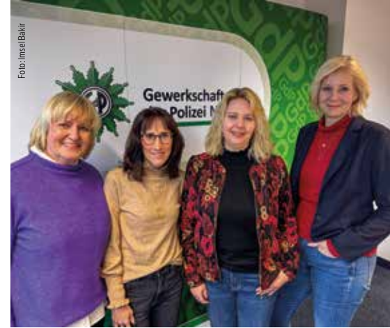
Das Rechtsschutzteam von der Landesgeschäftsstelle (Foto) arbeitet eng mit den Kreisgruppen zusammen.

Der Rechtsschutz funktioniert nur in einem starken Team. Nicht nur auf der Landesgeschäftsstelle, sondern auch und vor allem mit den Kreisgruppen vor Ort, die sich kümmern, und allen Mitgliedern, die helfen. Und gemeinsam sind wir für Euch da, 2023 mehr als 2.000-mal. Denn das ist unsere Leidenschaft! ■