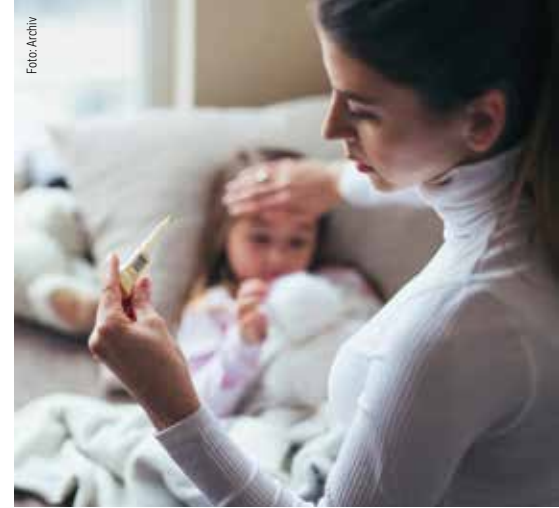
Die GdP drängt auf eine dauerhafte Regelung für Kinderkrankentage.

In den vergangenen Jahren folgte im Anschluss auf diese Regelung, die sich im Sozialgesetzbuch findet, eine Übertragung auf den Beamtenbereich. Eine solche Verweisregelung gibt es bisher allerdings nicht. Verbeamtete