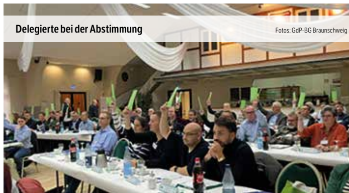
Delegierte bei der Abstimmung