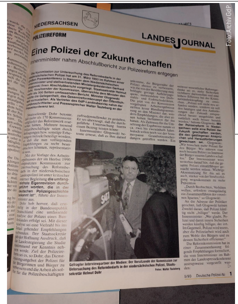
Im Landesjournal der DP vor 30 Jahren wurde ausführlich über die Polizeireform berichtet.