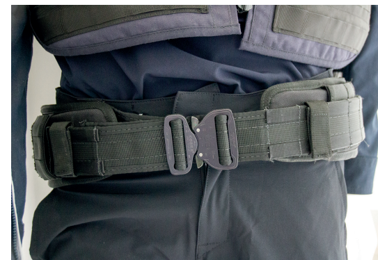
Der neue Einsatzgürtel mit gepolsterten Untergürtel bietet einen deutlich angenehmeres Tragegefühl. Er ist über die Dienststellen beziehbar.