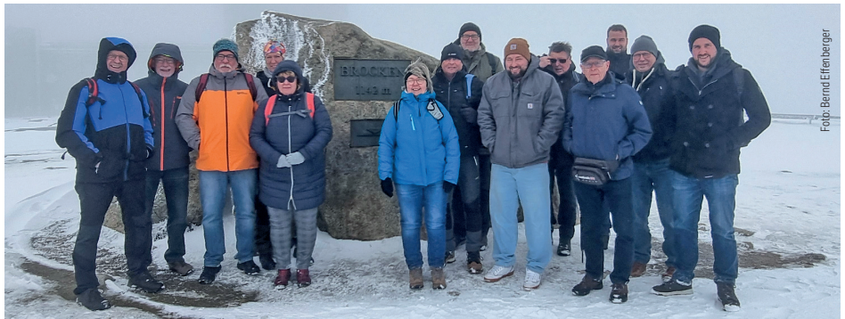
Auch das „typische Brockenwetter“ konnte der guten Stimmung der Teilnehmenden nichts anhaben.

Die Kreisgruppe Osterode hatte auf ihrer Jahreshauptversammlung im Jahr 2023 beschlossen, eine Tagesfahrt für die Mitglieder durchzuführen. Am 25. April 2024 ging es aus Südniedersachsen mit einem gecharterten Reisebus in den Harz zum Bahnhof „Drei Annen Hohne“, wo ein Zug der Harzquerbahn – natürlich mit einer Dampflokomotive – bestiegen wurde, der die Gruppe auf den Brocken brachte. War das Wetter bis hierhin recht gut, herrschte auf dem Gipfel Nebel, und nach vorangegangenen Schneefällen war die Bergkuppe bei Temperaturen deutlich unter dem Gefrierpunkt in winterliches Weiß getaucht. Beim Brockenwirt gab es einen ersten Imbiss und Getränke. Nach dieser Stärkung ging es mit dem Dampfzug zurück nach Drei Annen Hohne, wo der Bus die Teilnehmenden zum nächsten Höhepunkt der Fahrt brachte: die Rappbodetalperre, ebenfalls in Sachsen-Anhalt, mit der weltweit längsten Hängebrücke dieser Art, die sich mit über 483 Metern Länge in rund 100 Metern Höhe über das Rappbodetal zieht. Die meisten der Kolleginnen und Kollegen ließen es sich