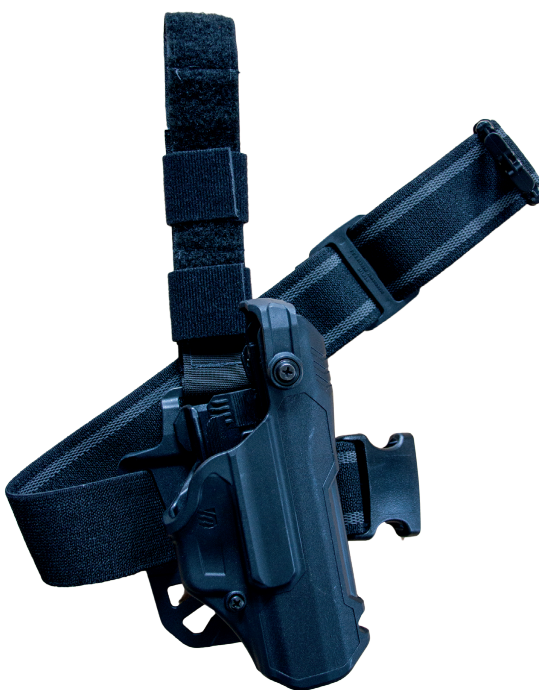
Ab Oktober soll die Halteplatte des Oberschenkelholsters für ein Jahr über das Bekleidungsbudget beschaffbar sein.