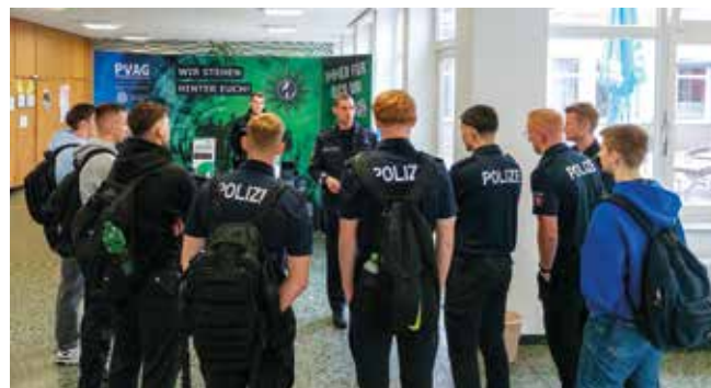
Reges Interesse an den Infoständen in Oldenburg ...

Eure Arbeit hat sich gelohnt: Durch die Vorstellung der GdP und eure Gespräche konntet ihr mehr als 80 Prozent der neuen Studierenden überzeugen, Mitglied in der größten und schönsten Polizeigewerkschaft der Welt zu werden! ■