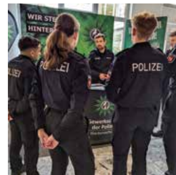
... und Nienburg