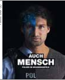
Auch Mensch – Auftakt 2012