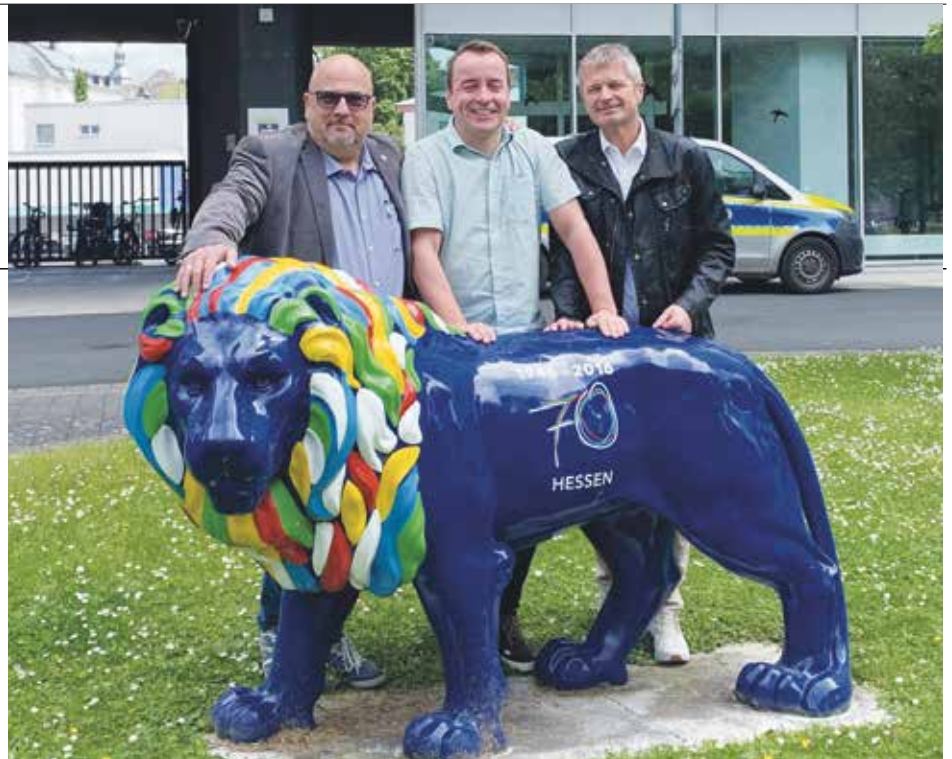
Übergabe am Löwen vor HMdI

kussionen und Erörterungen im Vorfeld verlief die eigentliche Veranstaltungszeit des Turniers weitgehend störungsfrei und ohne größere Zwischenfälle. Dies darf jedoch nicht darüber hinwegtäuschen, dass diese knapp fünf Wochen eine sehr belastende und fordernde Zeit für alle Beteiligten gewesen ist. Neben dem nicht alltäglichen Dienstgeschehen musste ja schließlich noch das Privat-/Familienleben organisiert werden. Egal ob Mainarena, Stadion, Taunusstein oder der Grundschutz, alle Aufgaben wurden durch die eingesetzten Kollegen vorbildlich abgearbeitet. Als Wertschätzung für die geleistete Arbeit wurden durch das Innenministerium kurzfristig Gelder für eine Abschlussfeier freigegeben. 1.000 Beschäftigte der hessischen Polizei konnten den während der EM genutzten Verpflegungsstützpunkt in der Messe für einen kleinen Umtrunk in gebührenden Rahmen nutzen. Staatssekretär Rößler dankte den Einsatzkräften, auch stellvertretend für den im Urlaub befindlichen Minister, für das aufgebrachte Engagement und lobte nochmals ausdrücklich die vollbrachte Arbeit. Einziger Wermutstropfen der Veranstaltung war die geringe Teilnehmerzahl, da weit mehr als die 1.000 zugelassenen Beschäftigten an diesem Großereignis beteiligt waren.