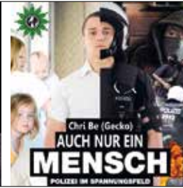
Auch Mensch – Version 2.0