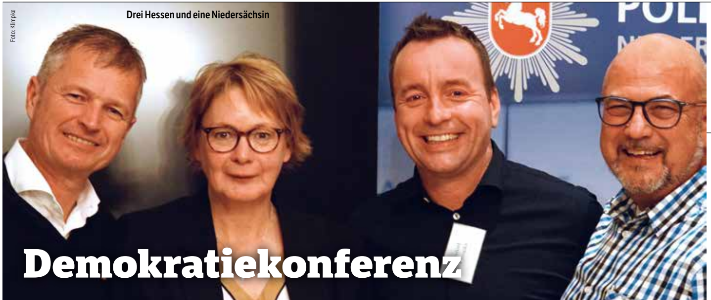
Drei Hessen und eine Niedersächsin