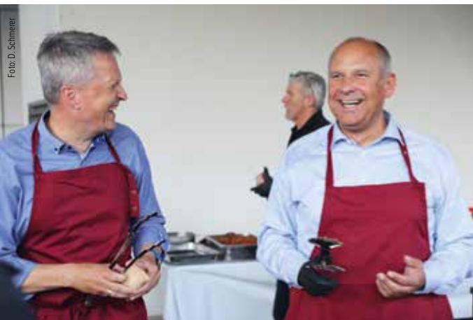
Minister Poseck und StS Rößler bei der Essensausgabe

Schlagworte werden hier regelmäßig bedient. Eine dieser Maßnahmen war die bereits im Koalitionsvertrag verkündete Erhöhung der Polizeizulage. Diese wird zum 1. Januar 2025 auf 160 € angehoben, leider ohne die Ruhegehaltsfähigkeit wiederherzustellen. Die Erhöhung der Polizeizulage, die durch die GdP lange gefordert wurde, war eine der Maßnahmen im sogenannten Respekt-Paket. Weitere Maßnahmen in diesem Paket sind unter anderem die fortlaufende Modernisierung der persönlichen Schutzausstattung, Ausweitung vom Taser oder auch die Ausflächung der Bodycam an die kommunalen Ordnungsbehörden. Die Fortführung der Schutzschleifenkampagne und die Sensibilisierung über die gängigen Social-Media-Kanäle gehören ebenso dazu. Darüber hinaus gab es beispielsweise in Gießen den Auftakt der Respekt-Kampagne für