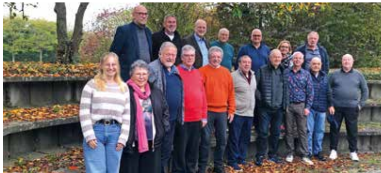
Teilnehmende des Seminars Medienkompetenz