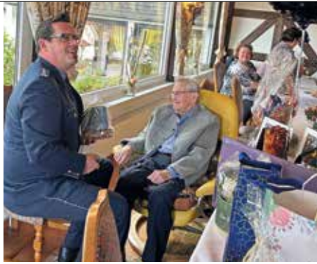
Von der Dienststelle überbringt nn Glückwünsche.