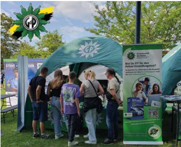
Der GdP-Stand an der Fachhochschule