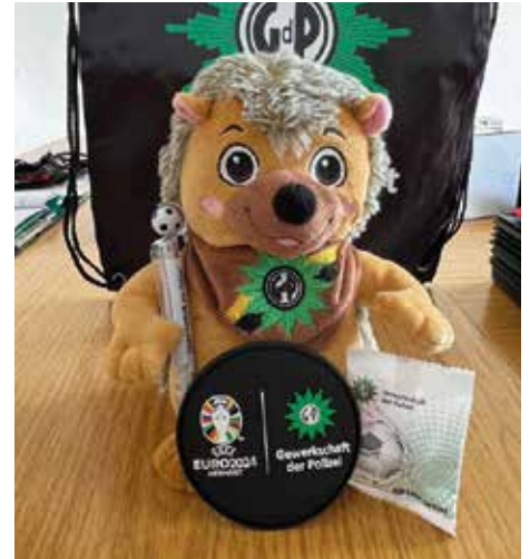
Unser Igel vom Förderverein war bestens auf das Fußballereignis vorbereitet.