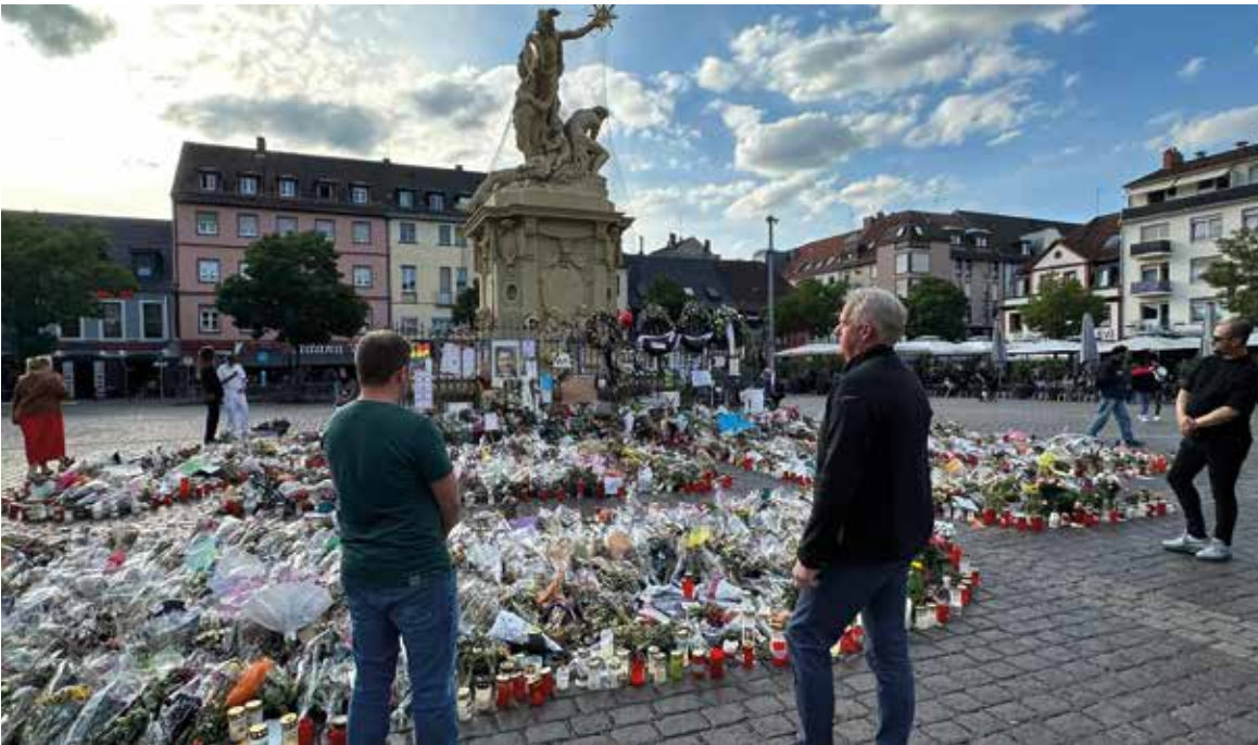
Vertreter unseres Landesvorstandes haben an der Trauerfeier in Mannheim teilgenommen.