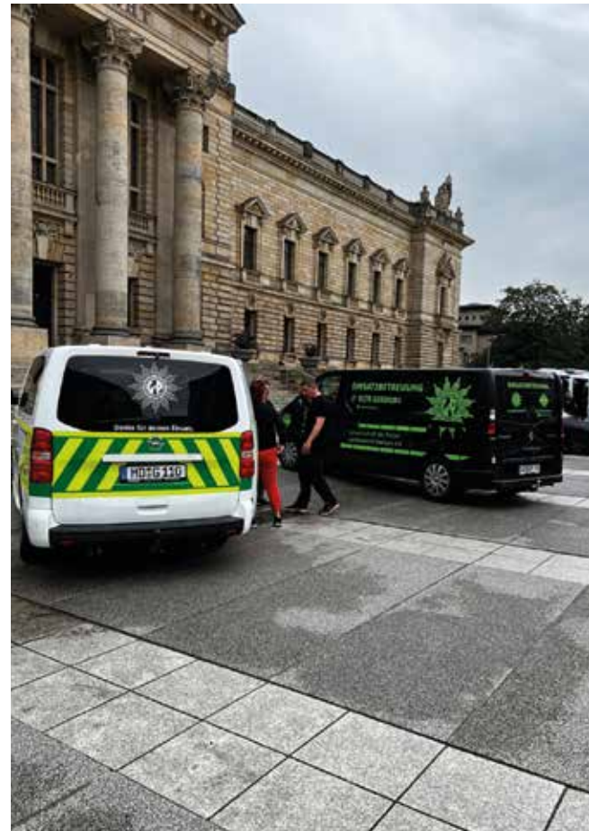
Die Kollegen aus Sachsen waren natürlich auch da.