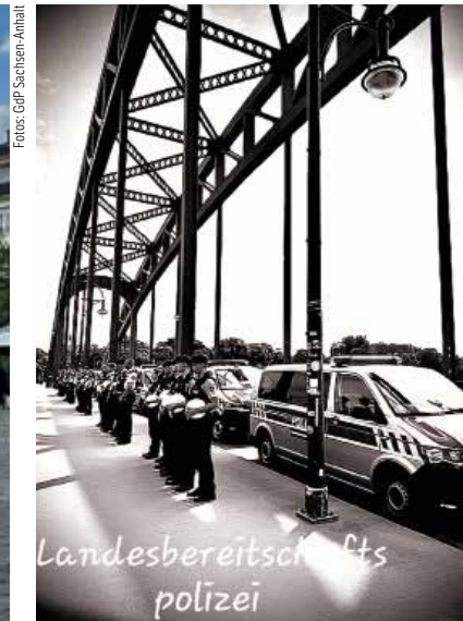
Die Kolleginnen und Kollegen der Landesbereitschaftspolizei auf der Sternbrücke in Magdeburg während der Schweigeminute am 7. Juni 2024 um 11:34 Uhr.