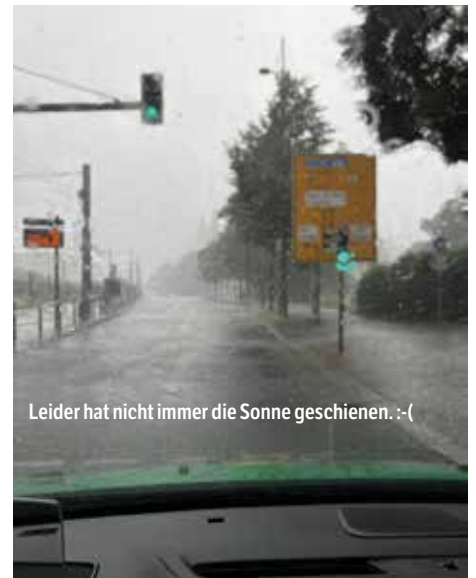
Leider hat nicht immer die Sonne geschienen. :-)