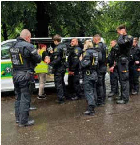
Im Einsatzraum haben wir dann auch „unsere“ Kräfte getroffen und versorgt.

Ich bin in der GdP, weil ihr uns bei unseren Einsätzen immer mit Leckereien versorgt. Wir halten immer Ausschau nach eurem grünen GdP Bus.