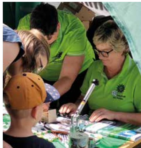
Gerade bei den kleinen Gästen waren unsere Buttons heiß begehrt.

Interessierte konnten sich an Teilen des Testverfahrens, z. B. dem Deutschttest sowie dem Intelligenzstrukturtest, ausprobieren. Hier setzen wir auch als GdP Sachsen-Anhalt an. Mit unserem Partner „Ausbildungspark“ geben wir Interessierten das beste Werkzeug an die Hand, um sicher durch die Einstellungsauswahlverfahren zu kommen.