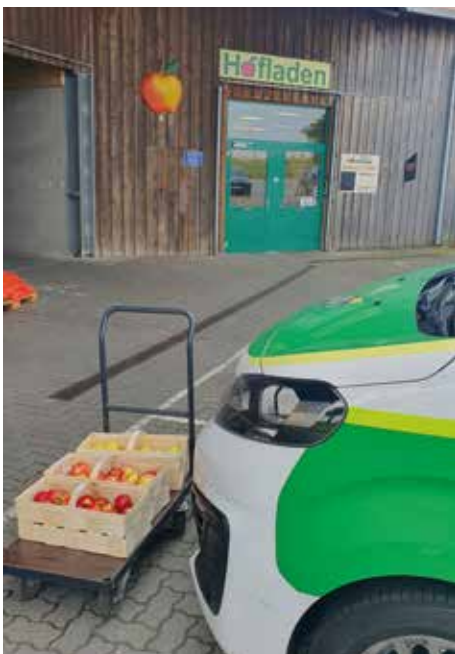
Neben den üblichen „Leckerlis“ für die Einsatzbetreuung haben wir auch wieder frisches Obst dagehabt.

Auch am zweiten Tag der Einsatzbetreuung unterstützte ein engagiertes Team aus Sachsen-Anhalt die Kolleginnen und Kollegen des Landesbezirks Sachsen. Diesmal war die 4. Hundertschaft aus Sachsen-Anhalt zur Unterstützung nach Leipzig gereist, um zu unterstützen.