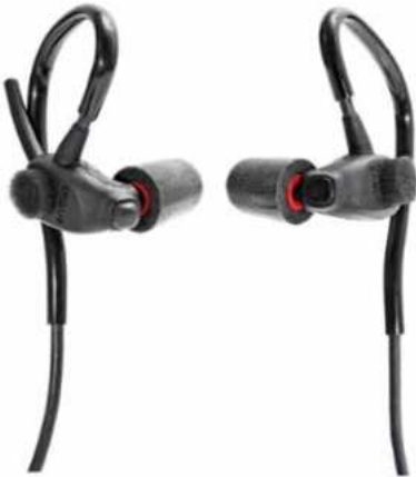
Bald im Einsatz: das Headset Invisio X5 (54 g, 2 Meter tauchfähig, Hear-through-Mikrofon u. v. m.) für Führungskräfte und Einsatzbeamte

Während sie ihren Dienst versehen, werden Bereitschaftspolizisten regelmäßig mit verschiedenen Formen von Lärmbelastungen konfrontiert, sei es bei der Absicherung von Fußballspielen, der Bewältigung von Demonstrationen oder dem Einsatz während der Silvesternacht. Diese Einsätze stellen bereits an sich anspruchsvolle Situationen dar, doch die Präsenz von Böllern und anderen lauten Explosivstoffen verstärkt die Belastung erheblich. Das laute Knallen der Böller trägt nicht nur zu einer physischen Belastung bei, sondern kann auch zu einer erhöhten Stressbelastung und Anspannung für die Polizisten führen. Darüber hinaus besteht die reale Gefahr von Gehörschäden durch die extremen Lautstärken, denen sie ausgesetzt sind. Diese Vielfalt an Lärmbelastungen macht die Arbeit der Bereitschaftspolizisten noch anspruchsvoller und unterstreicht die Notwendigkeit von geeigneten Schutzmaßnahmen und Ressourcen für ihr Wohlbefinden und ihre Sicherheit während des Dienstes.