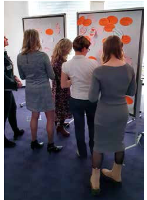
Beim Workshop wurde selbstverständlich auch gearbeitet.