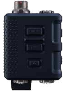
Bald im Einsatz: die Kontrolleinheit V60 GEN II (152 g, 20 Meter tauchfähig, Squelch-Funktion u. v. m.) für Führungskräfte

Die Petition der GdP ( https://innn.it/boellerverbot ) für ein bundesweites Böllerverbot steht kurz davor, die Marke von 100.000 Unterstützern zu erreichen. Obwohl ein Umdenken in der Bevölkerung erkennbar ist, fehlen bisher die politischen Mehrheiten, um dieses Verbot umzusetzen. Daher setzt sich die Gewerkschaft verstärkt für verbesserte Arbeitsbedingungen ihrer Bereitschaftspolizisten ein, insbesondere für eine zeitgemäße persönliche Schutzausstattung. Die Forderung nach aktivem Gehörschutz wurde in den letzten Jahren jedoch leider nicht ausreichend berücksichtigt.