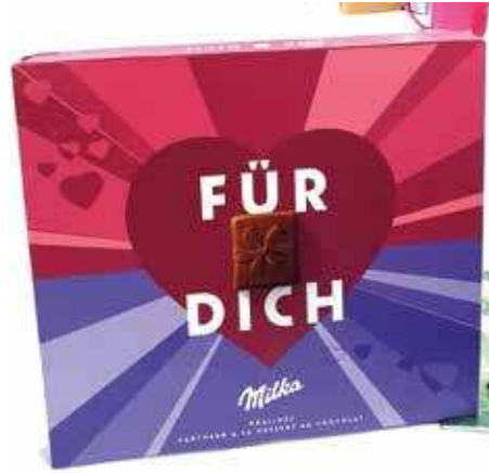
Für Dich. Für Euch. Die Landesfrauengruppe.

staltet, welcher dazu dienen sollte, Aufgaben für den Vorstand der Frauengruppe zu erarbeiten. Es kamen an den einzelnen Tischen angeregte Diskussionen zustande und die Ergebnisse wurden dann von den Teilnehmerinnen vorgestellt.