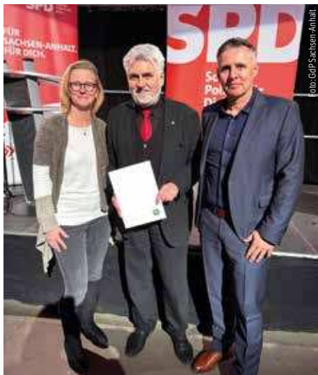
Übergabe des Schreibens der GdP an Bundesratsmitglied Minister Prof. Willingmann (SPD)

Ab 1. April kann man es selbst ausprobieren und das ganz legal. Ein neues Gesetz findet nunmehr seinen Einzug in den Alltag: das Gesetz zum kontrollierten Umgang mit Cannabis und zur Änderung weiterer Vorschriften (kurz: Cannabisgesetz – CanG).