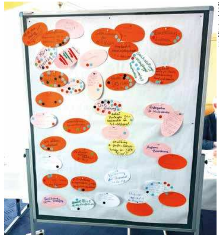
Im Workshop trugen die Teilnehmerinnen zahlreiche Themen und Aufgaben für den neuen Vorstand zusammen.