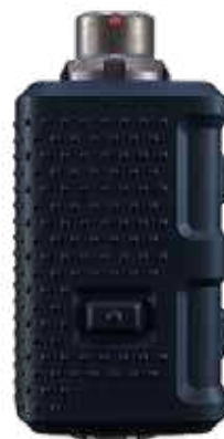
Bald im Einsatz: Kontrolleinheit V20 GEN II (100 g, 20 Meter tauchfähig, Squelch-Funktion u. v. m.) für Einsatzbeamte

Die Gewerkschaft der Polizei (GdP) kämpft seit Jahren gegen die unverantwortliche Praxis der Geistervertreibung zu Silvester und das problematische Verhalten von Fußballfans.