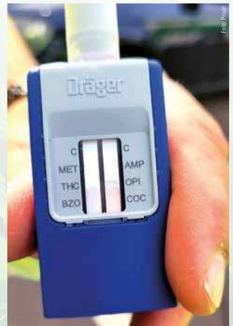
So sieht ein Speichel-Drogentest aus, hier ein Produkt der Firma Dräger.