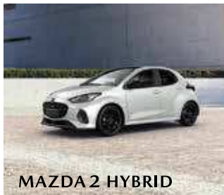
MAZDA 2 HYBRID