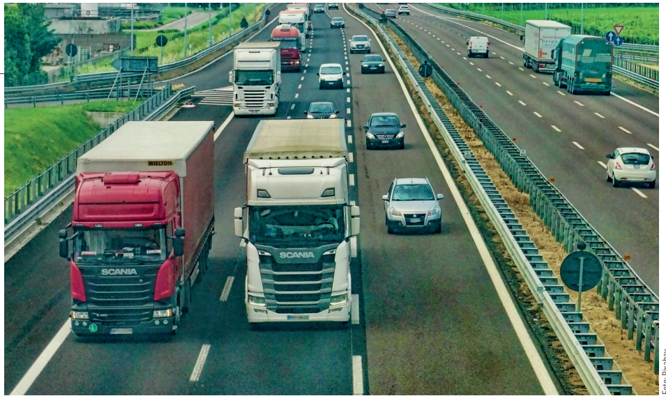
Für alle Autobahnen in Rheinland-Pfalz sollen Fahndungseinheiten eingerichtet werden

Auch in Sachen moderne Ausstattung konnten wir einiges erreichen. Ein Projekt des Innenministeriums hat sich mit der praktischen Erprobung einer neuen Generation teilstationärer Geschwindigkeitsmesssysteme befasst, die wesentlich flexibler einsetzbar sind als die bisherigen Geräte. Dabei war es wichtig, die Anwenderinnen und Anwender miteinzubeziehen und die Erfahrungswerte