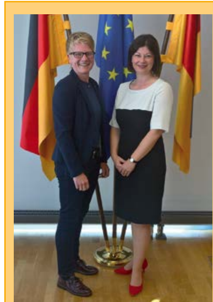
Besuch der neuen Staatssekretärin Nicole Steingaß in der Sitzung des Hauptpersonalrates: Bei der Gelegenheit entstand dieses „staatstragende“ Foto. Mehr über den Besuch auf Seite 6. In der Augustausgabe bringt die DP ein Interview mit der neuen Führungskraft im Innenministerium.