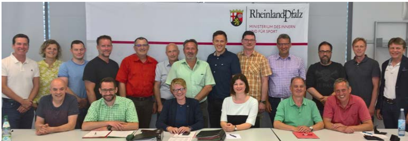
Staatssekretärin Nicole Steingäß (3. v. l., Bildmitte neben der Vorsitzenden Sabrina Kunz) zeigte sich als souveräne Gesprächspartnerin des Hauptpersonalrates. Es blieb ihr kein kritisches Thema – etwa „GAP-WSD“ – erspart. In einigen Redebeiträgen wurden die eingeleiteten Maßnahmen der Landesregierung aber auch anerkennend erwähnt. Im Hinblick auf die Erstellung des Einzelhaushaltes 2021 ging es vor allem um die Beibehaltung des hohen Einstellungsniveaus für Polizistinnen und Polizisten, aber auch um erhebliche Handlungsbedarfe im Bereich der Rekrutierung von tariflichem Fachpersonal.

Diese Themen wurden in der Juni-Sitzung des Hauptpersonalrates behandelt: