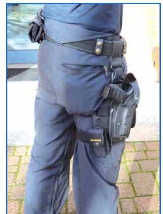
Die drei allseits bekannten Trageweisen der Dienstwaffe – ohne Steg, kurzer Steg, langer Steg – werden absehbar um eine weitere Option komplettiert: Das Oberschenkelholster. Das Oberschenkelholster ist in einigen Bereichen, z. B. der Werttransporteinheit, bereits im Gebrauch und wird aktuell, zusammen mit einer leichteren Körperschutzausstattung, in der Praxis getestet. Im Laufe des Jahres dürfte es als zusätzliche Trageoption zur Verfügung stehen. Wer wegen des Holsters unter orthopädischen Problemen leidet, kann sich auch heute schon an seine Behörde wenden. Das Oberschenkelholster kann ggfs. Abhilfe schaffen.