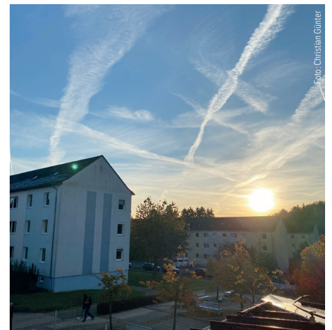
Der Hahn im Sonnenaufgang