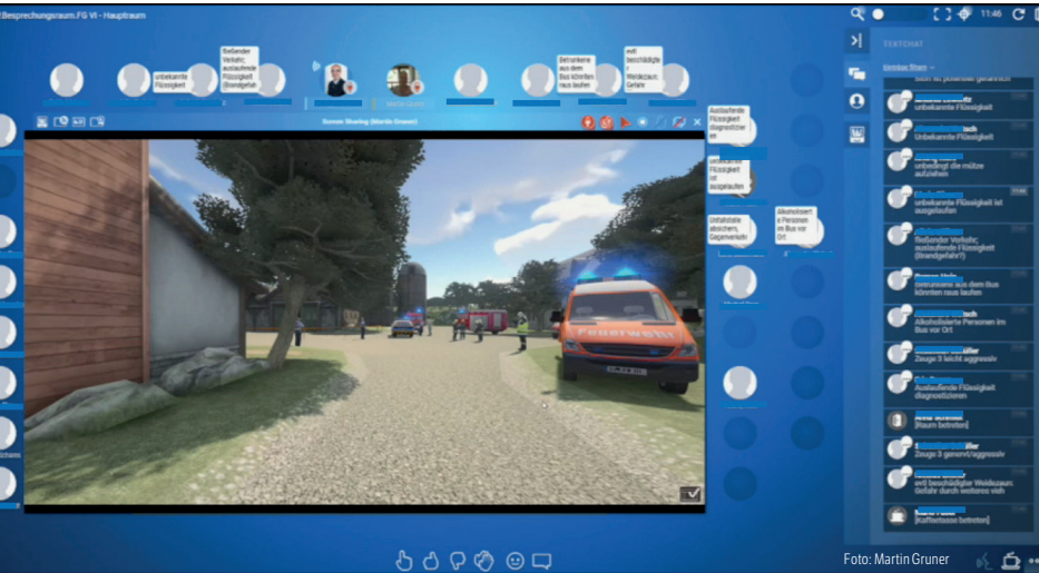
Screenshot einer Übungssituation

Hörsäle zu einem Simulationszentrum sowie der Entwicklung didaktischer Konzepte zur Nutzung dieser neuen Methode wurde der Grundstein für die weitere Entwicklung gelegt.