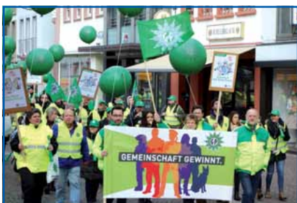
Die GdP auf der „Anreise“