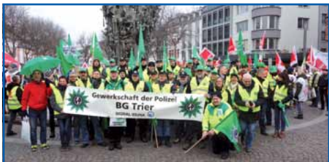
Die GdP-BG Trier bei der Teambildung