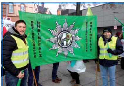
Pfälzische Nachbarn in tragender Rolle