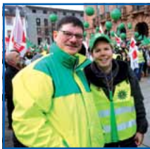
Waren dabei: Tarif-Kollegen (oben) und Beamte (unten)

„Es gibt was zu verteilen, holen wir es uns!“