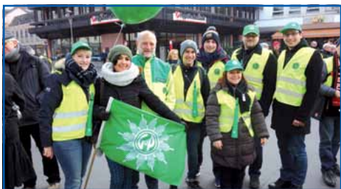
Die JUNGGE GRUPPE war stark vertreten.