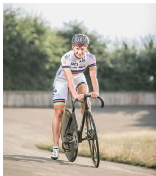
Miriam Welte in ihrem Element

Welte: Natürlich die Olympischen Spiele, einmal die in London 2012, wo ich im Teamsprint Gold gewonnen habe, und einmal in Rio de Janeiro 2016, da habe ich ebenfalls im Team