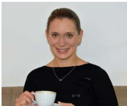
Auf einen Kaffee mit Miriam Welte

„Miriam Welte ist eine ehemalige deutsche Bahnradsportlerin. Sie ist Olympiasiegerin, wurde sechs Mal Weltmeisterin und errang 21 deutsche Meistertitel“, so beginnt ihr Eintrag in Wikipedia. Außerdem ist sie unsere Kollegin, die nun bald wieder komplett als Polizistin einsteigen wird. Ein Grund, die 33-Jährige zu einem Interview zu bitten.