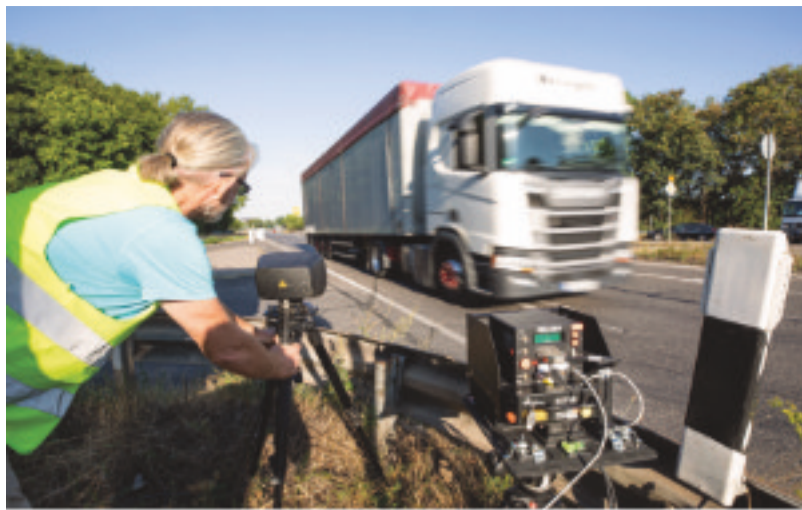
Die einheitliche Dienstbekleidung für Regierungsbeschäftigte im Außendienst kommt.