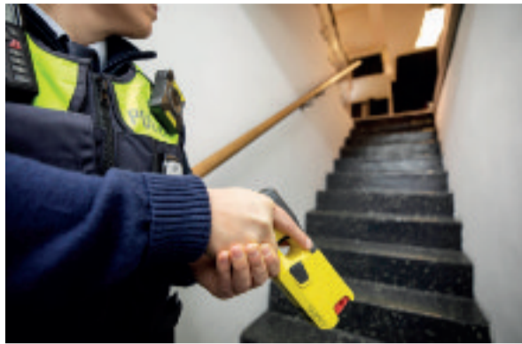
Der Taser muss landesweit in allen Kreispolizeibehörden zur Verfügung stehen.

Und da sind wir beim Thema: Polizeiarbeit ist Teamwork! Darum