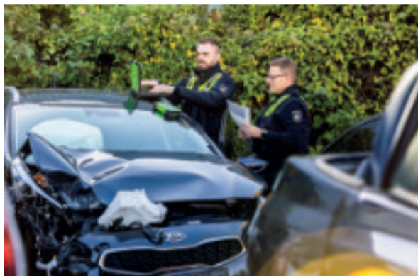
Die GdP fordert ein eigenes Verteilpotenzial für V in der Funktionszuordnung LG 2.1.