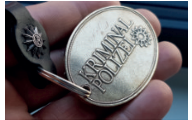
Die Attraktivitätssteigerung bei K muss endlich angegangen werden!